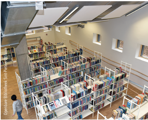
Openbare Bibliotheek Sint-Pieters-Woluwe