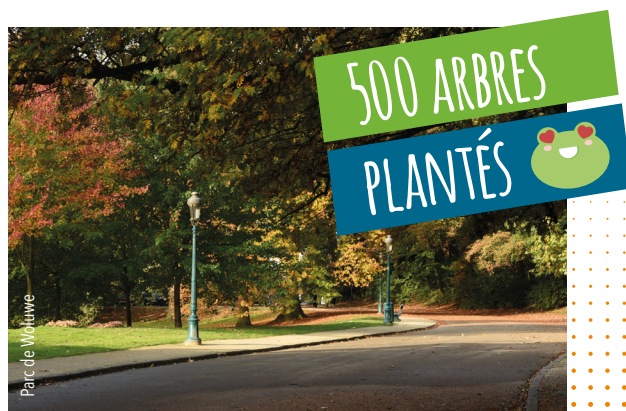
Parc de Woluwe

Avec ses 200 hectares d'espaces verts - soit 1/4 du territoire -, Woluwe-Saint-Pierre est la commune « la plus nature » de la Région Bruxelloise. Pour préserver ce cadre de vie idyllique et renforcer la qualité de vie de nos quartiers, nous menons, depuis presque 5 ans, une politique environnementale durable et dynamique. La plantation de plus de 500 arbres et l'installation de panneaux photovoltaïques sur plusieurs bâtiments communaux sont deux exemples parmi tant d'autres qui illustrent notre volonté de faire de notre commune la référence en matière de préservation de l'environnement.