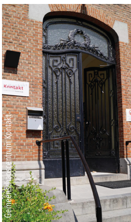
Gemeentehuis van Sint-Pieters-Woluwe

De bouwwerken voor de renovatie en de uitbreiding van de gemeentelijke basisschool van Mooi-Bos zijn gestart : 5 nieuwe klassen op de zolderverdieping. Op 1 september 2018 zal de nieuw school klaar zijn. Bovendien zal de school helemaal asbestvrij zijn.