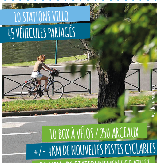
Place Dumon / Athénaanleg Dumonplein