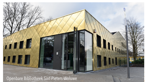
Openbare Bibliotheek Sint-Pieters-Woluwe

Sinds 2015 : structurele subsidie van 5.000 € voor het Lokaal Dienstencentrum Zoniënzorg.